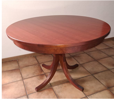
Ess-/Couchtisch Durchmesser 110 cm