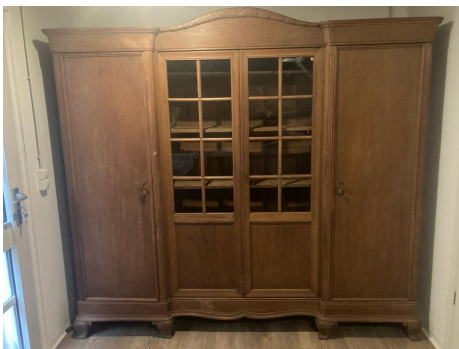
(kann ggf. auch gebracht werden)