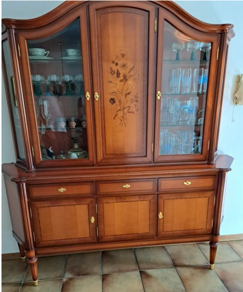
Wohnzimmerbuffet HxBxT 2,1 x 0,5 x 2 m