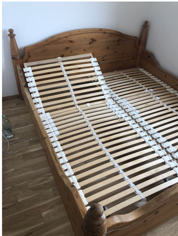
Massivholz-Doppelbett mit Lattenrosten hochwertige Schreinerarbeit