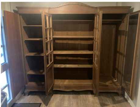
Massiver Eichenkleiderschrank (um 1930), bereits zerlegt, LxTxH 220 x 65 x 185 cm